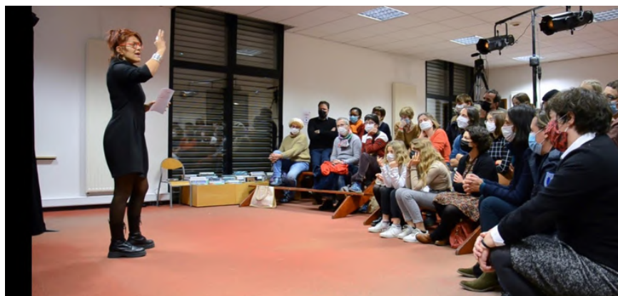
Représentation de novembre 2021 à Acigné

Les retours du public furent tellement enthousiastes que nous avons eu envie de développer cette proposition et de créer un véritable spectacle : prendre le temps d' affiner l'écriture , et travailler une mise en scène originale .