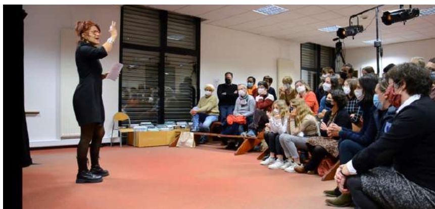
Représentation de novembre 2021 à Acigné

Les retours du public furent tellement enthousiastes que nous avons eu envie de développer cette proposition et de créer un véritable spectacle : prendre le temps d' affiner l'écriture , et travailler une mise en scène originale .