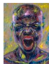
Le Héros aux mille et un visages Joseph Campbell